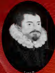
Stanley Lane Poole